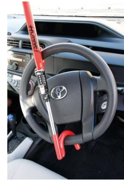
取り付けイメージ