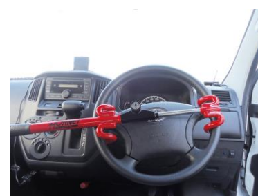
取り付けイメージ