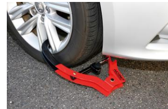
取り付けイメージ

装着条件：タイヤ幅 300mm以下。ホイールに 35×35mm以上の隙間が必要です。