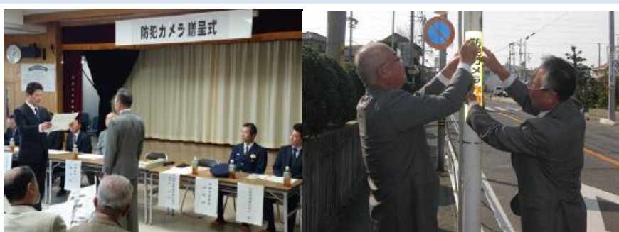
防犯カメラ設置促進活動

半田市成岩3区防犯カメラ促進活動(愛知県)に参加しています。当社は、防犯カメラの設置に協力いたしました。