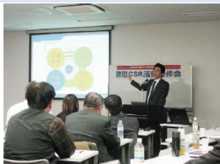
盗難防止に関する講演会